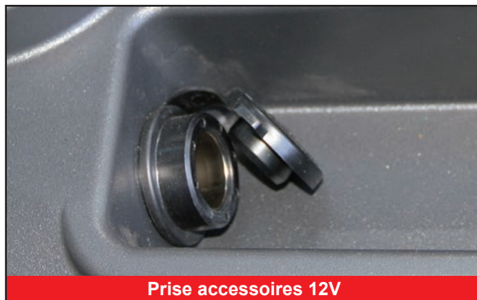
Prise accessoires 12V