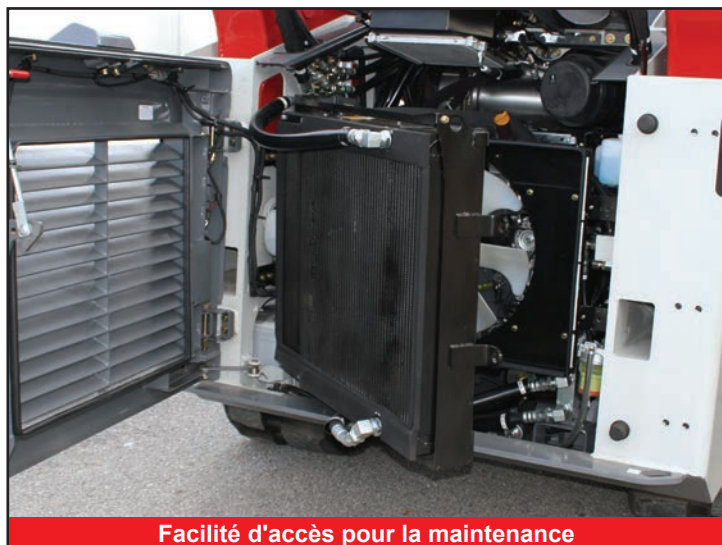
Facilité d'accès pour la maintenance