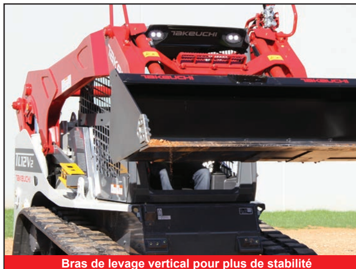
Bras de levage vertical pour plus de stabilité