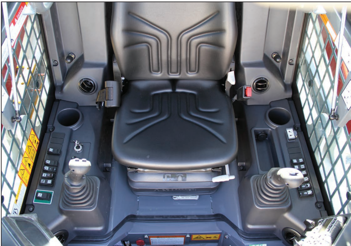
Poste de conduite spacieux avec commandes et interrupteurs faciles d'accès

Ses performances sont accrues grâce à son bras de levage et ses vérins surdimensionnés, son pare choc arrière avec points d'ancrage intégré, son module de refroidissement haute capacité et ses phares de travail à LED avant et arrière. L'intérieur du TL12V2 comprend un écran couleur, des interrupteurs à bascule, des joysticks à commande hydraulique, un siège luxe à suspension.