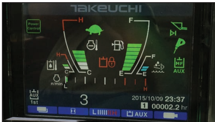
Ecran couleur 5.7" avec caméra de recul