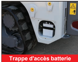
Trappe d'accès batterie