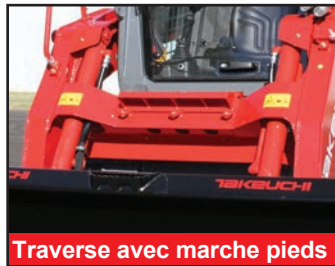
Traverse avec marche pieds