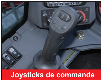
Joysticks de commande