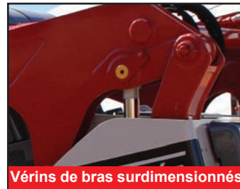
Vérins de bras surdimensionnés

Première chargeuse compacte sur chenilles à levage vertical chez Takeuchi, le TL12V-2 démontre un engagement continu envers l'amélioration et l'innovation des produits. Il s'agit de la chargeuse sur chenilles la plus grande et la plus performante disponible aujourd'hui elle offre la meilleure capacité de fonctionnement nominale de sa catégorie, un poste de conduite entièrement repensé doté d'un écran couleur multi-fonctions avec caméra de recul, des interrupteurs à bascule pour contrôler une large gamme de fonctions et une conception de train de roulement mise à jour qui améliore le confort de l'opérateur en réduisant les niveaux de vibration et de bruit.