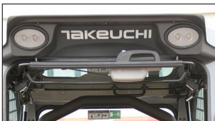
Porte à bascule