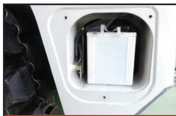
Trappe d'accès batterie