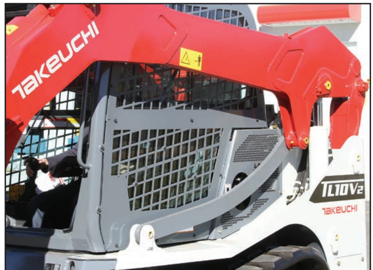
Bras de levage vertical pour plus de stabilité