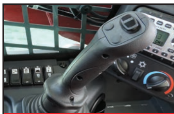
Joysticks de commande