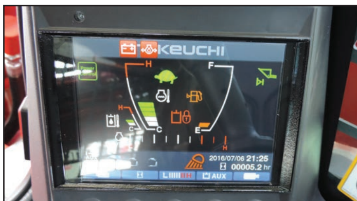
Ecran multi-fonctions couleur