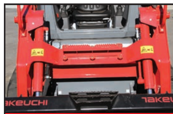
Traverse avant avec marche pieds