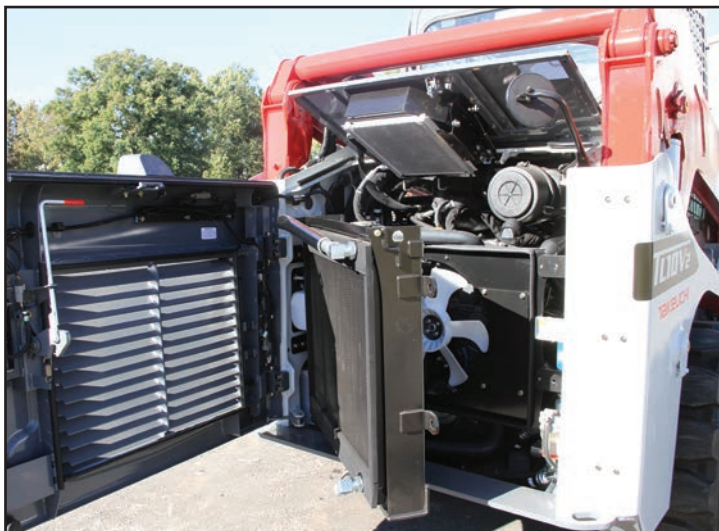
Facilité d'accès pour la maintenance