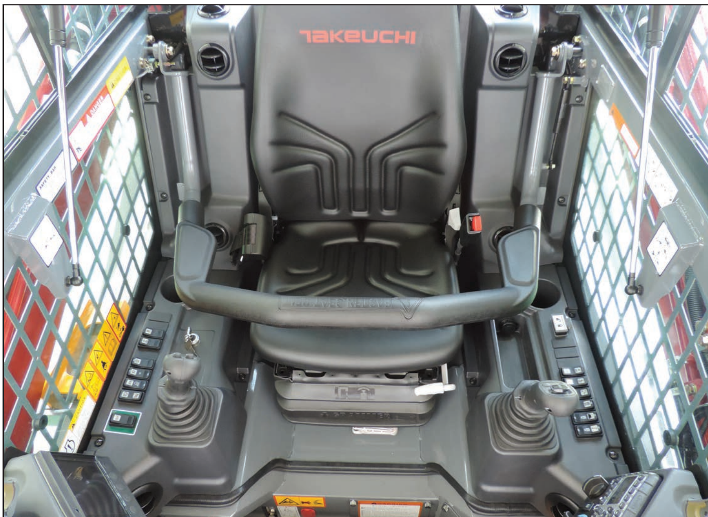
Poste de conduite spacieux avec commandes et interrupteurs faciles d'accès.

Un train de roulement avec un système de chenilles silencieuses à blocs larges offre une qualité de roulement améliorée et une réduction du bruit et des vibrations. Un puissant moteur de 54,6 kW répond aux normes Stage V tout en offrant un mélange exceptionnel de puissance et de couple pour des performances impressionnantes dans la plupart des applications exigeantes.