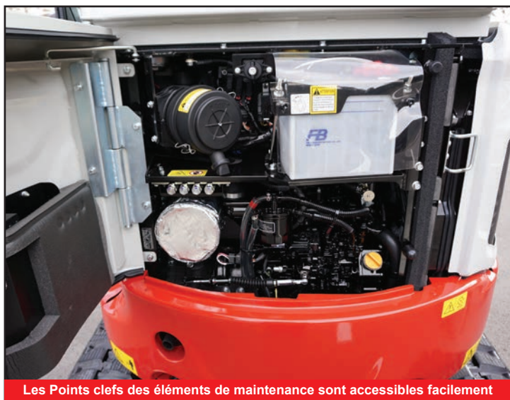
Les Points clefs des éléments de maintenance sont accessibles facilement