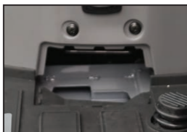
Trappe de lavage