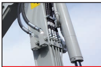
Jusqu'à 4 Ports (Option)