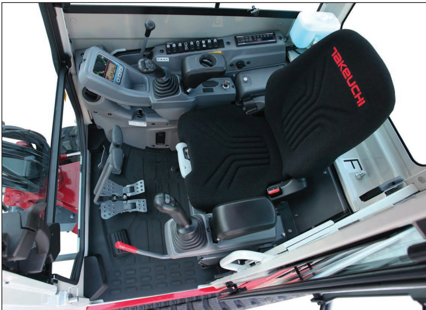
Poste de conduite spacieux avec commandes et interrupteurs faciles à atteindre

Les caractéristiques standard de la TB325R comprennent un système de purge automatique du carburant qui élimine le besoin d'amorcer manuellement le système d'alimentation en carburant, une décélération automatique du moteur qui aide à économiser le carburant, la trappe de sol facilite le nettoyage et un contrepoids enveloppant robuste qui aide à protéger les composants vitaux. Les fonctionnalités supplémentaires disponibles sur le TB325R comprennent un ensemble d'éclairage de travail à LED, plusieurs circuits hydrauliques auxiliaires et un système télématique Takeuchi Fleet Management (TFM) en option.