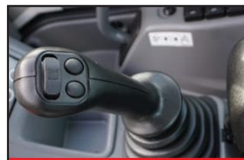
Commandes hydrauliques par joystick

La TB325R est la dernière nouveauté de la gamme de pelles de la série 300 de Takeuchi. Ce nouveau modèle présente une conception à rayon court qui réduit la quantité de porte-à-faux du contrepoids, ce qui améliore la maniabilité et la productivité sur les chantiers confinés. En raison de sa taille compacte et de son poids léger, le TB325R peut être facilement transportée.