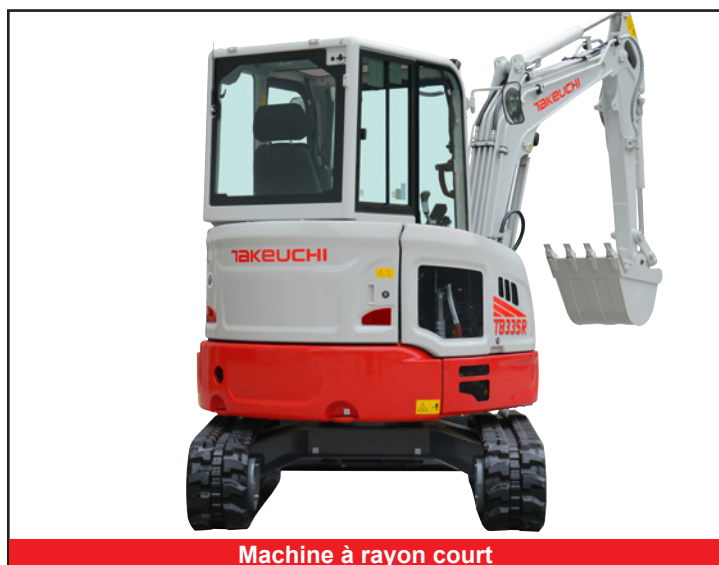
Machine à rayon court

*Les fonctions peuvent ne pas être disponibles dans tous les pays, veuillez donc consulter votre revendeur Takeuchi pour plus de détails.