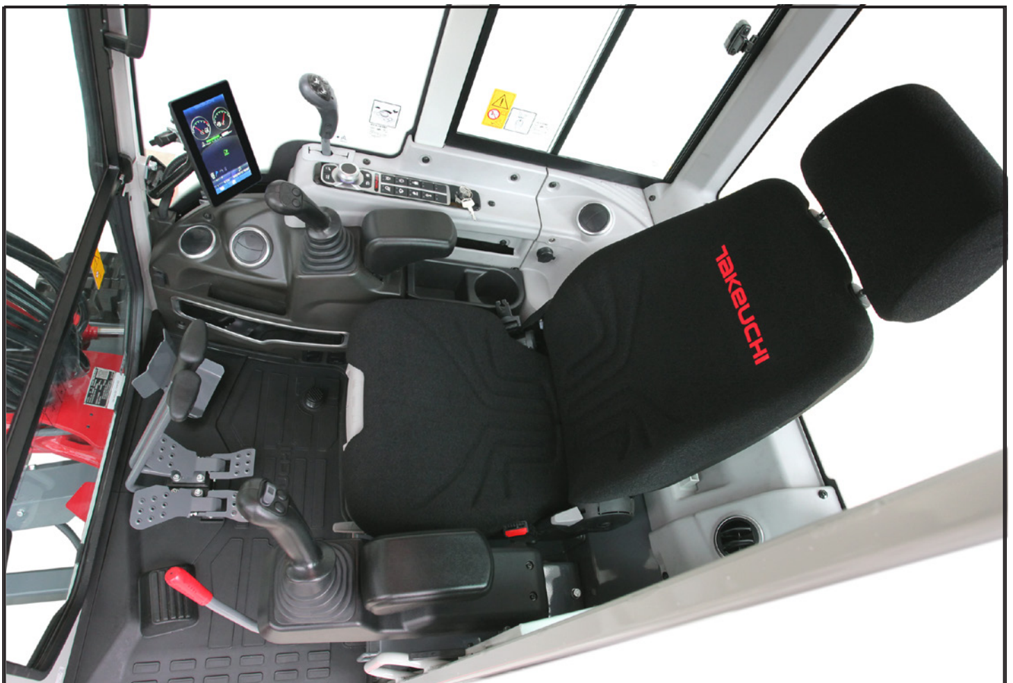
Intérieur de style automobile entièrement repensé avec un fonctionnement intuitif pour l'utilisateur

Les inspections et les entretiens quotidiens sont faciles à effectuer avec les capots à grande ouverture. Avec les capots ouverts, l'opérateur peut rapidement inspecter le séparateur d'eau, le radiateur, le refroidisseur d'huile, la jauge de niveau d'huile hydraulique, le niveau de carburant, les filtres à air, le niveau de liquide de refroidissement, la jauge d'huile moteur et la batterie..