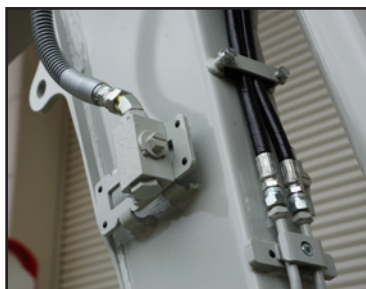
Up to 4 Service Ports (Optional)