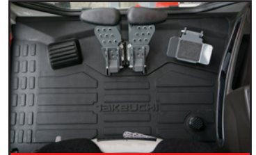
Plancher avec repose-pieds

Dernière pelle de la série 300, la TB335R présente une conception de type urbain qui vous permet de vous concentrer davantage sur votre travail et d'être performant et de moins se préoccuper des impacts sur le contre-poids. Les opérateurs trouveront que le rayon court de la TB335R offre une excellente maniabilité et accessibilité aux chantiers confinés sans sacrifier la stabilité. Avec force et puissance au godet et au bras qui offrent une large plage de travail et des performances inégalées. Un opérateur confortablement installé est un opérateur plus productif et la TB335R possède un large éventail d'améliorations qui permettront à l'opérateur de se sentir bien. Ces améliorations comprennent un intérieur entièrement repensé qui comprend un bloc de commande avec un joystick interactif, un écran couleur haute définition, un siège luxe à suspension avec appui tête et