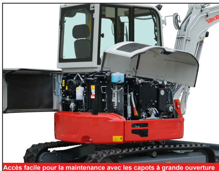
Accès facile pour la maintenance avec les capots à grande ouverture