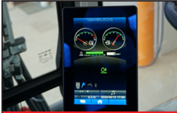
Écran tactile 7" (CABINE)