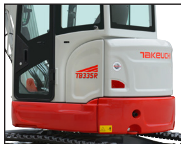
All Steel Construction