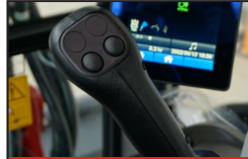
Joysticks à commandes hydraulique