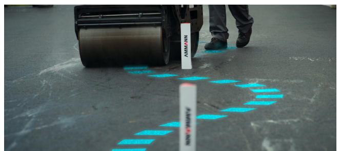
AWR 65-S Rouleau à guidage manuel avec angle de direction de 15°